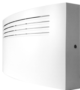
KS16301010.301 - vox-C - blanc perle KS16301011.301 - vox-M - blanc perle