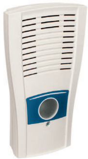
Réf. STILIC FLASH