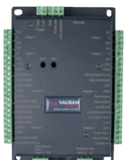
Réf. : VERSO®+4 4 lecteurs