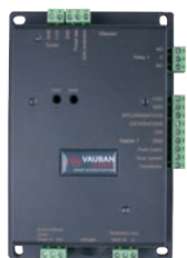
Réf. : VERSO®+ 1 1 lecteur