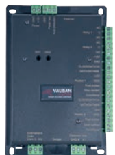
Réf. : VERSO®+2 2 lecteurs