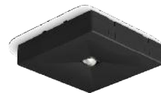
R A1S BLACK