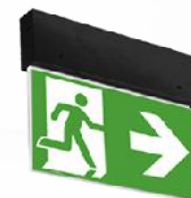
G E2S BLACK