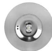
C A1S MÉTAL