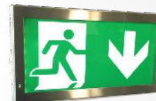
E E1S MÉTAL