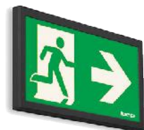
E E1S BLACK LED Chaudes ou Blanches