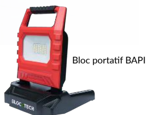
Bloc portatif BAPI

ONE-DUO IP65 sans Télécommande (CE mais pas NF)