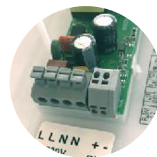
Connecteurs rapides 4 ports