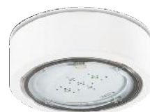
I A1S - 520 lm