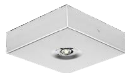
R A1S MÉTAL