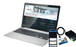
Kit de programmation SECARD et les protocoles SSCP® v1 & v2® et OSDP™