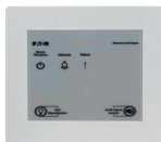
Tableau de synthèse - AT Replica LED

NUG32048 Tableau de synthèse - AT Replica LED