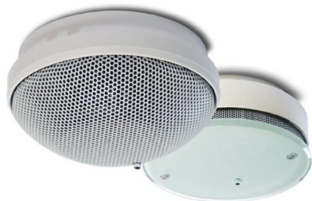
KSF5300001.001 - design verre KSF5300001.003 - design mesh