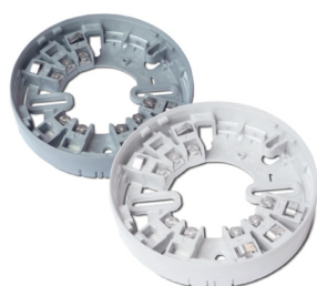
Base séparée avec connexion à baïonnette