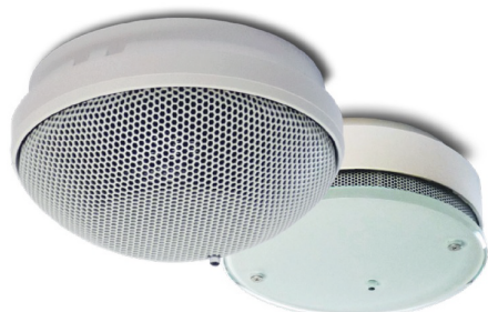
KSF5100001.001 - design verre KSF5100001.003 - design mesh