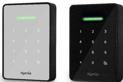
KS12100031.302 - ergo-X noir KS12100031.303 - ergo-X gris